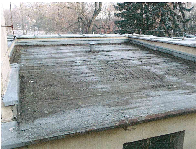
Fot.4 Pomieszczenie ze stropem drewniany krytym papą