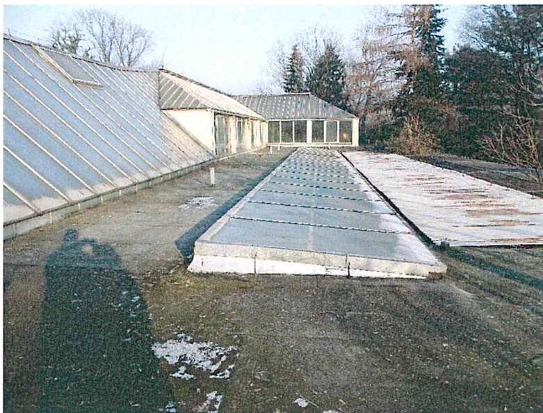
Fot.3 Świetliki pokryte poliwęglanem w stropodachu krytym papą