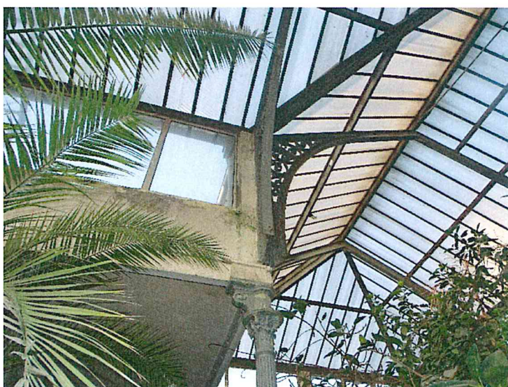
Fot.2 Więżba dachowa stalowa w dachu dwuspadowych - miecz

Pozostałą część przykryta jest stropodachami pokrytymi papą, oraz wyposażona od strony zachodniej i wschodniej w płaskie świetliki kryte poliwęglanem (fot. 3). Pomieszczenia na drugim poziomie w północnej części budynku (przy portalu wejściowym) (fot. 4 i 5) ze stropem drewniany z pełnym deskowaniem pokrytym papą.