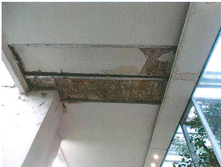
Fot.6 Stropodach typu Kleina

Stropodach typu Kleina z wielu miejsc ubytki w tynku na stropie. (fot.6) Widoczne belki stropu skorodowane, należy doczyścić i pomalować. W wielu miejscach tynki popękane lub uszkodzone. Widoczne cegły w konstrukcji stropu z ubytkami spoin. Przed nałożeniem tynku, cegły i spoiny należy oczyścić i uzupełnić ubytki. Pokrycie stropu z papy do wymiany.