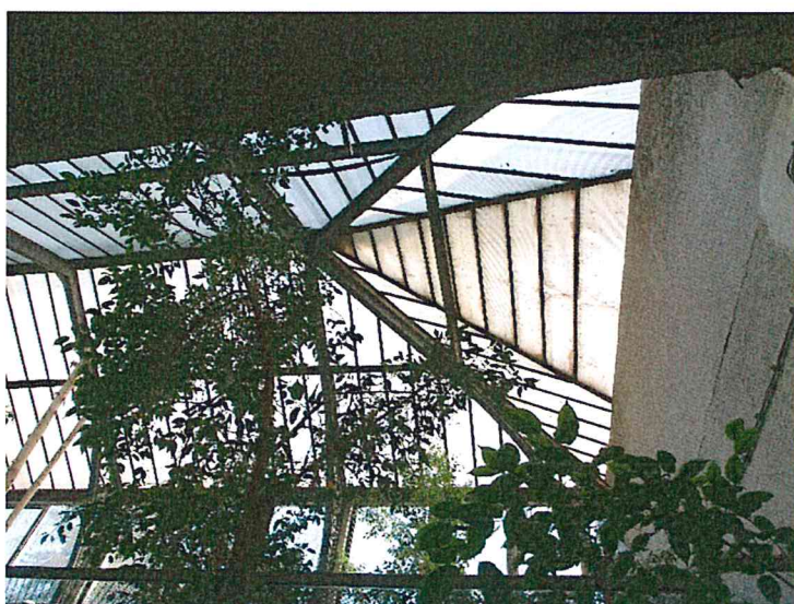
Fot.1 Więżba dachowa stalowa

Więźba dachowa stalowa w dachu dwuspadowych o konstrukcji krokwiowej z belka kalenicową i jedną płatwią pośrednią na każdej połaci (fot.1). W dachu ze świetlikami pionowymi krokwie opierają się na słupach za pośrednictwem ozdobnej konstrukcji stalowej pełniącej funkcje miecza (fot. 2).