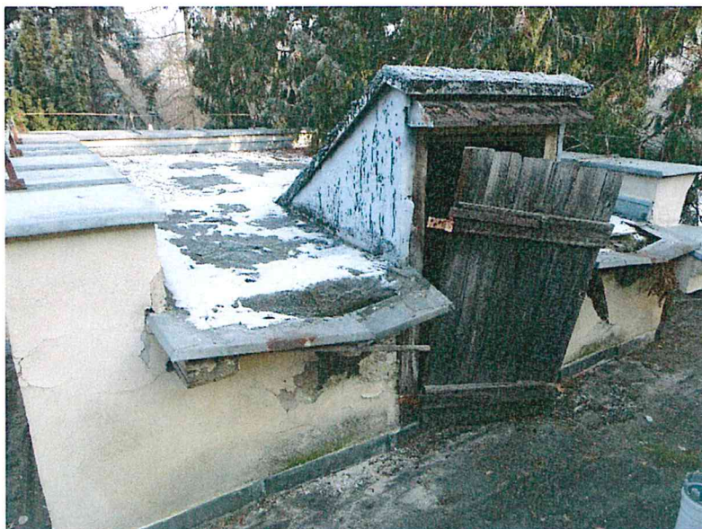
Fot.5 Pomieszczenia ze stropem drewniany krytym papą